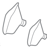
Adult mask Mascherina adulto Child mask Mascherina bimbo