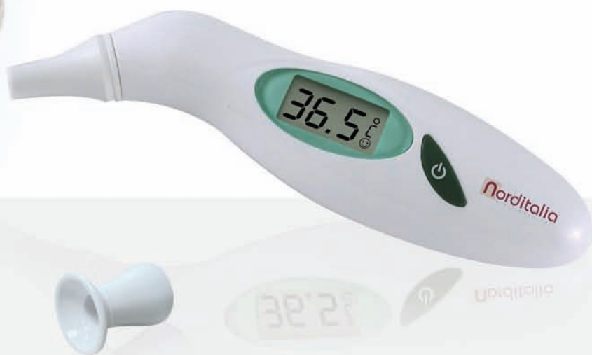
forehead adapter adattatore frontale