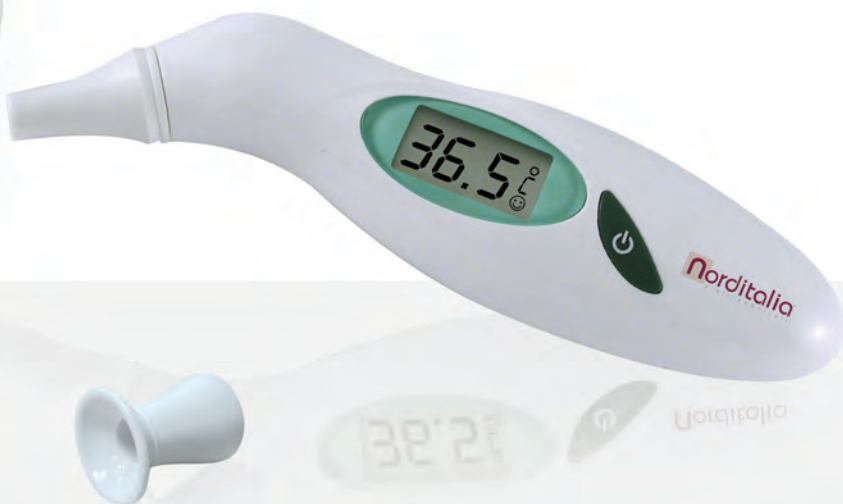
forehead adapter adattatore frontale